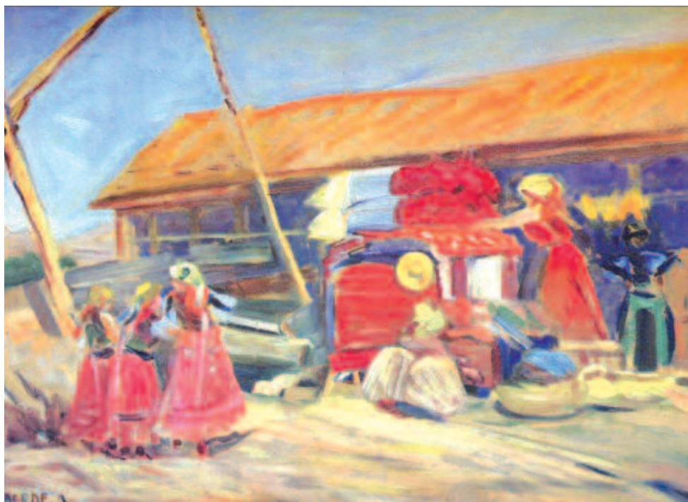
Rakják a kelengyét (Kalotaszegen)

Hosszú élete során, hiszen nyolcvanévesen is festett, gazdag, értékes életművet teremtett. Ezt bizonyítja a kiállítás, amely a 2017-es kolozsvári napokon a kincses város művészeti múzeumának kiállítótermében nyílt Merítés